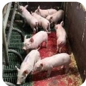
大学の養豚場で生まれた生後7日の豚たち