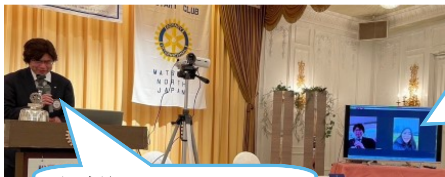
平野会員 文化の違いなど感じてますか？

留学先の宿はシェアハウスで5人(4人がドイツ人)一部屋で生活しているようです。食堂や、図書館など大学内、周辺を紹介してくださいました。また、会員との質疑応答も行いました。