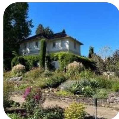
左:大学のボタニカルガーデン