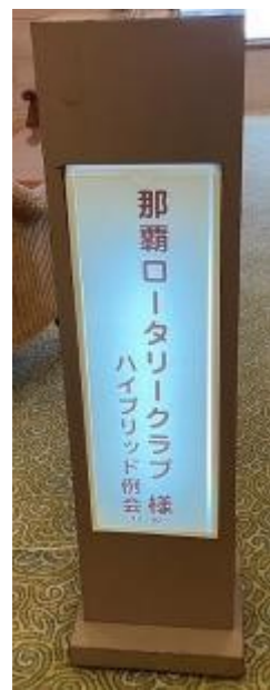
バナー交換の様子