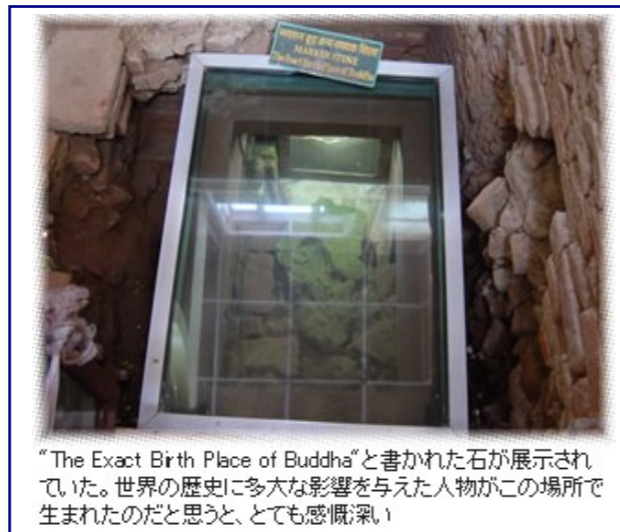
"The Exact Birth Place of Buddha"と書かれた石が展示されていた。世界の歴史に多大な影響を与えた人物がこの場所で生まれたのだと思うと、とても感慨深い