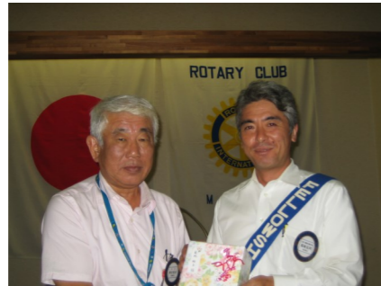
夫人誕生日 菊地克利会員（裕子様） 9月10日 長島正巳会員（聡子様） 9月26日