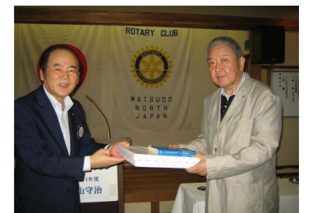
入会おめでとうございます。 末長くお付き合い下さい！