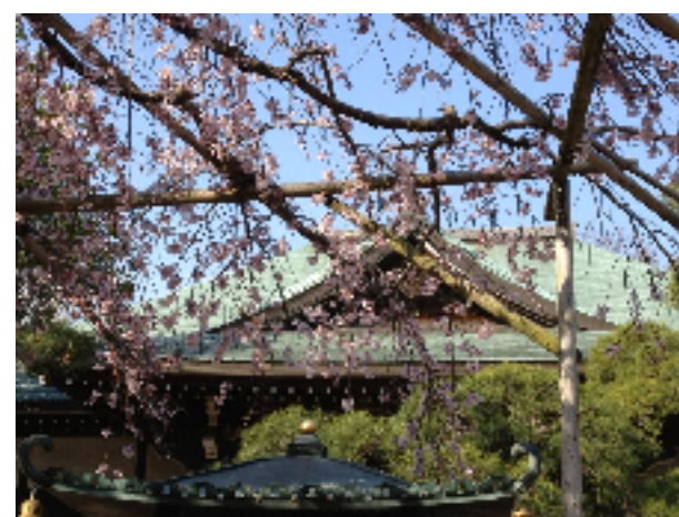
(東漸寺のしだれ桜)