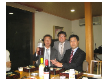
(小澤会員・小林辰幸会員・淵上会員)