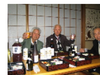
(吉田会員・中原会員・池田会員)