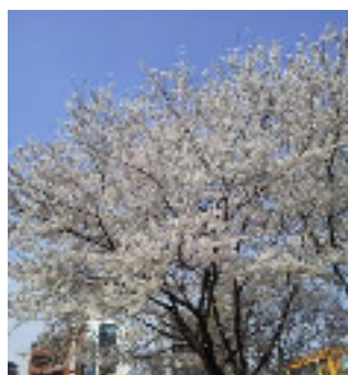
(北小金駅前の満開の桜)