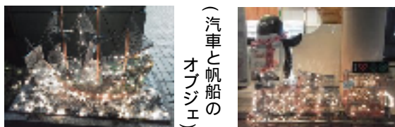
(自動車と帆船のオープンジェ)

YESから入るか NOから入るか できませんから始まる言葉 できません..... なぜならば やってみますから始まる言葉 やってみます..... どうやって