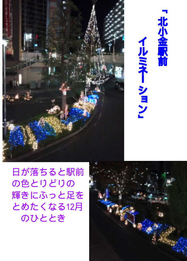
「北小金駅前イルミネーション」