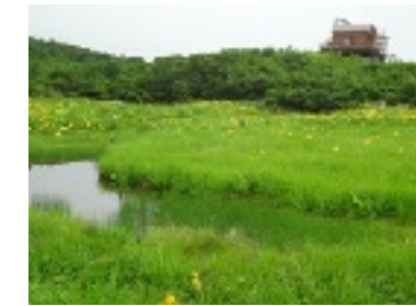
(白馬の美しい湿地)