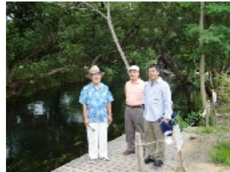
(安曇野の美しい水面の前にて)