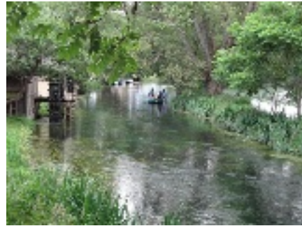
NHK朝ドラ「おひさま」のロケ地