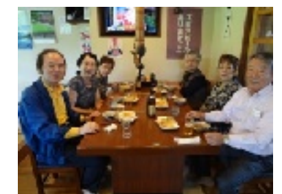
(美味しいそばをいただきました)