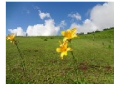
(白馬ではニッコウキスゲがきれいでした)