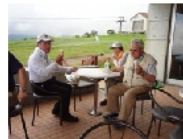
(みんなで美味しいソフトクリーム)