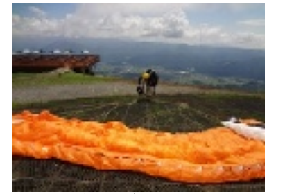
(パラグライダーを拝見しました)